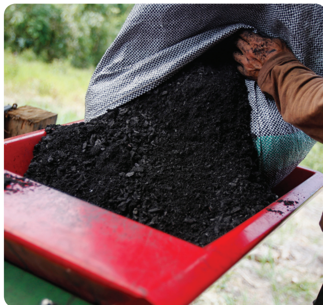
▲ Biokohle als CO 2 -Speicher

Mit Ricoh erhalten Sie einen Partner, der sich für Umweltbewusstsein engagiert und jedes Jahr aktiv Maßnahmen ergreift, um die Auswirkungen auf den Planeten zu minimieren.