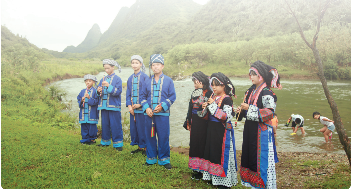
▲ Wiederaufforstung – Anhuang, China. Zertifiziert nach Verified Carbon Standard (VCS)

Beschreiten Sie mit uns den Weg in eine grünere Zukunft und schützen Sie den Planeten, indem Sie die Kohlenstoffemissionen durch den RICOH Carbon Balanced Service reduzieren.