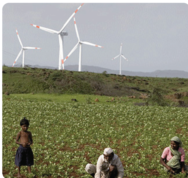
▲ Erneuerbare Windenergie, Indien